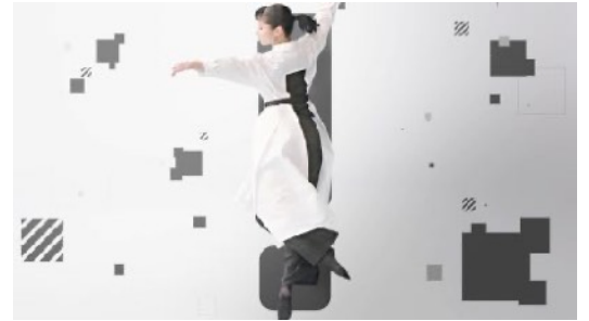
ワイジェイFX 「YJFX! JUMP with YOU」CM

★Telly Award 2021「Craft-Promotional Video部門」Gold 受賞