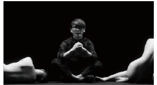
サカナクション 「ユリイカ」MV

アートネイチャー 「2画面プレゼン篇」他 あきんどスシロー 「2016 企業」「2015 企業」他多数 ファミリーマート 「サンドイッチリニューアル」他多数 アディダスジャパン& アルペン 「AKB48 マーキングサッカー日本代表ユニホーム」 イオン 「トップバリュ 新バーリアル」他 住友生命保険相互会社 「メッセージ篇」 楽天生命 「スーパー2000」他 東京土地建物 「Brillia 輝く街」改訂 日本医師会 「受動喫煙防止」 ★2018 JAA広告賞：入選 BANDAI 「ドラゴンボール ぶっちぎりマッチ」 ワイジェイFX 「YJFX! JUMP with YOU」 LOGISTEED (旧,日立物流)「企業」